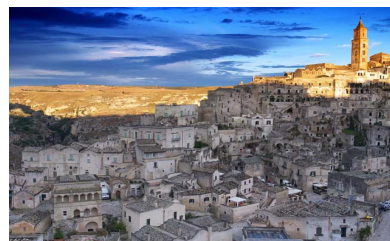
Matera – Capitale Europea della Cultura 2019, i Sassi