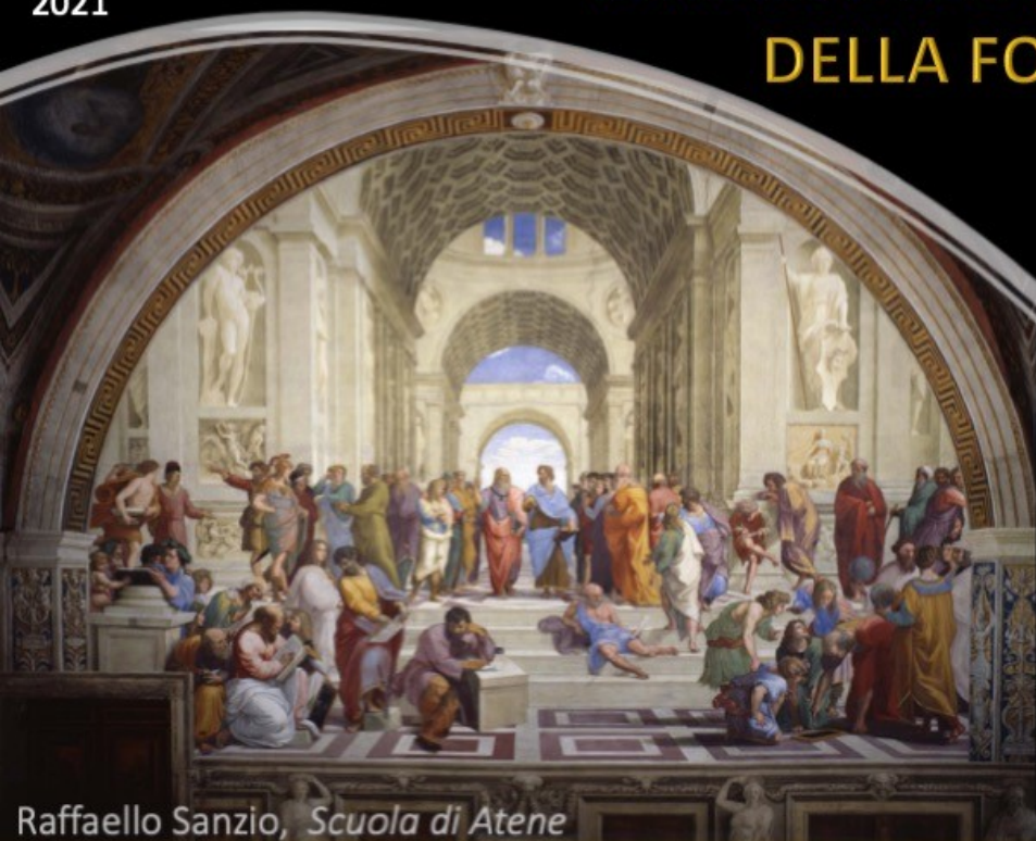
Raffaello Sanzio, Scuola di Atene